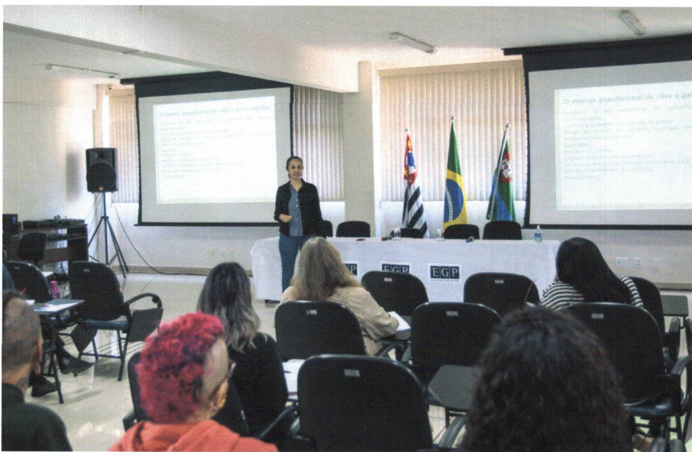
DEBEA abre inscrições para nova turma do Curso de Capacitação para Protetores de Animais